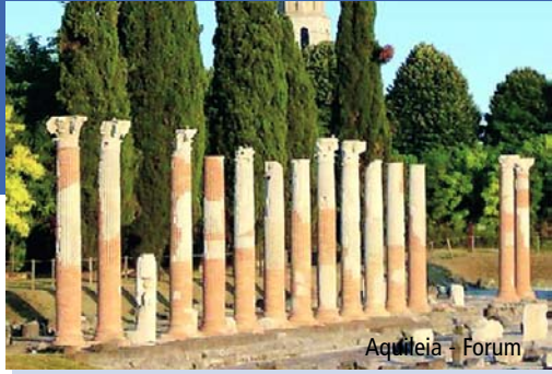
Aquileia - Forum