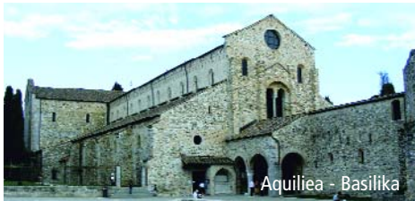
Aquileia - Basilika

Fahrt nach Spilimbergo am rechten Ufer des Tagliamento (Altstadt mit Türmen aus dem 14. Jh., gotischer Dom mit kostbaren Fresken, Schloss im Gotik- und Renaissancestil). Weiter nach San Daniele, der Heimat des gleichnamigen Prosciutto. Besuch eines Schinkenproduzenten und Mittagsimbiss mit typ. Speisen. Über Tarvisio - Villach zurück nach Nürnberg.