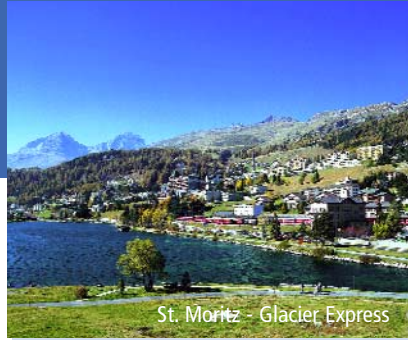
St. Moritz - Glacier Express