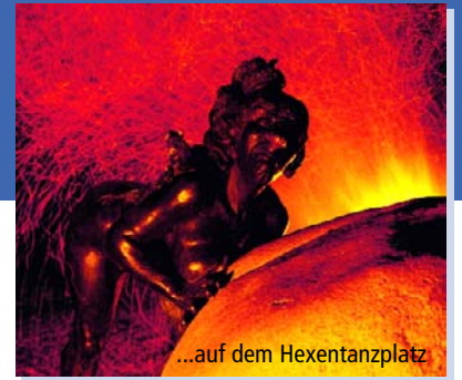
...auf dem Hexentanzplatz