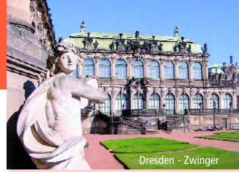
Dresden - Zwinger