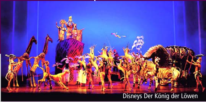
Disneys Der König der Löwen