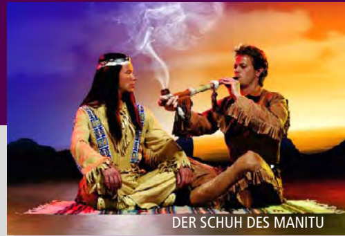
DER SCHUH DES MANITU