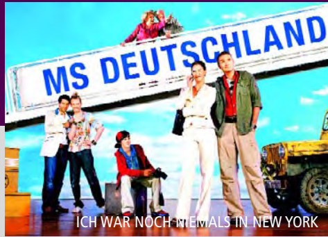
ICH WAR NOCH NIEMALS IN NEW YORK