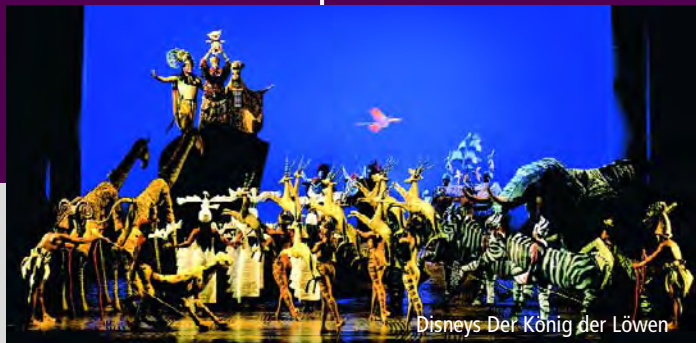
Disneys Der König der Löwen