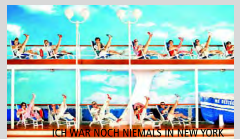
ICH WAR NOCH NIEMALS IN NEW YORK