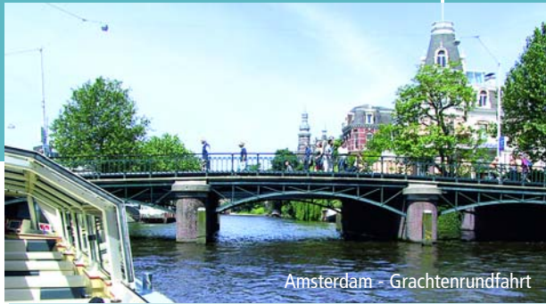
Amsterdam - Grachtenrundfahrt