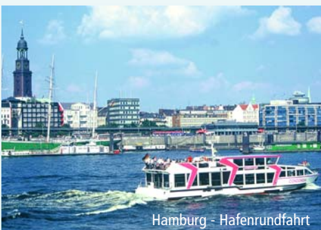
Hamburg - Hafenrundfahrt

Abfahrt: N 6.45 FÜ 6.15 ER 7.00 BA 8.00 HIR 7.45 FO 7.30 HAU 7.20 SC 6.00 NM 5.30 ALT 5.50 FEU 6.10 HEB 5.45 LAU 6.00 Rückkunft: ca. 21.00