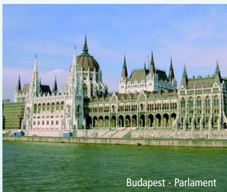
Budapest - Parlament

Heute steht Budapest abseits der Touristenpfade auf dem Programm. z. B. der Trödelmarkt und die Markthallen, wo Sie Gelegenheit haben, typisch ungarische Lebensmittel und Handwerkerzeugnisse preiswert einzukaufen. Auch die Margaretheninsel und das Stadtwäldchen gehören zum Programm. Als krönenden Abschluss besuchen Sie am Abend ein gemütliches landestypisches Restaurant in Budapest. Hier