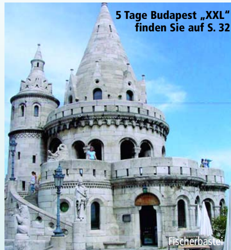
5 Tage Budapest „XXL“ finden Sie auf S. 32

Nach dem Frühstücksbuffet Rückreise auf der Autobahn nach Nürnberg.