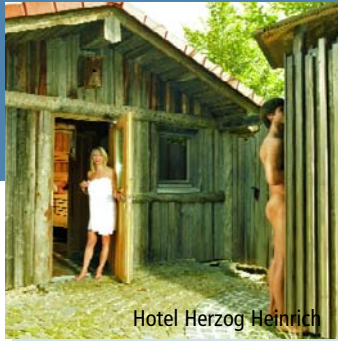
Hotel Herzog Heinrich