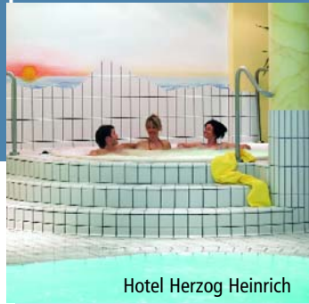
Hotel Herzog Heinrich