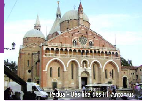
Padua - Basilika des Hl. Antonius