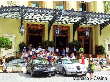
Monaco - Casino

Rückreise auf der Autostrada dei Fiori - Bozen - Brenner - München nach Nürnberg.