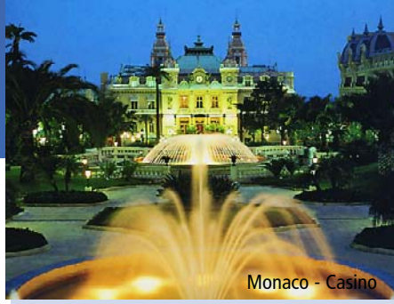
Monaco - Casino