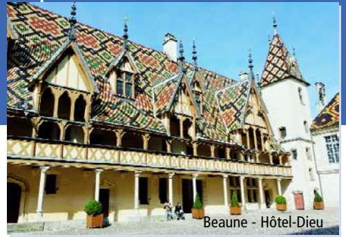
Beaune - Hôtel-Dieu